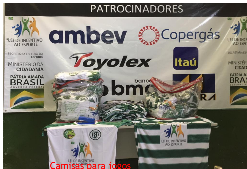
Camisas para jogos