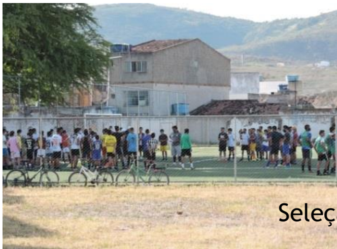
Seleção ( peneira)