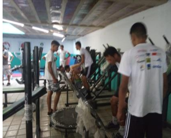
TREINOS NA ACADEMIA