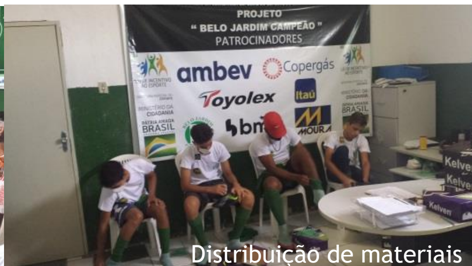
Distribuição de materiais