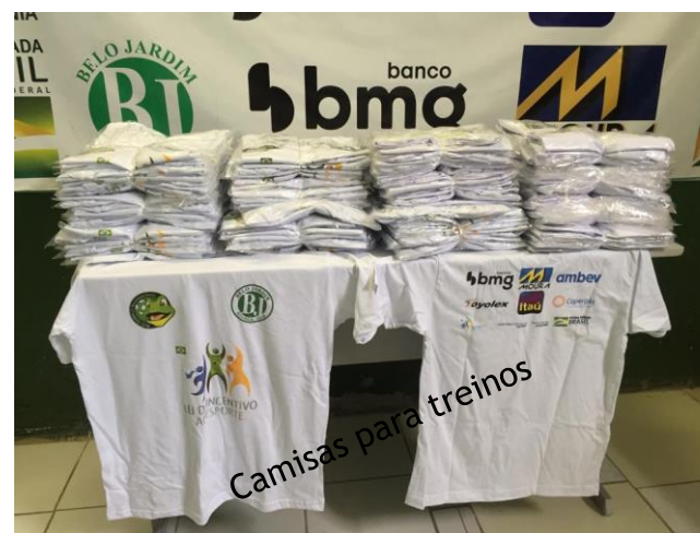
Camisas para treinos