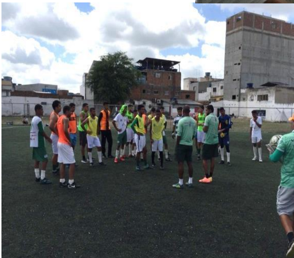
Execução do projeto