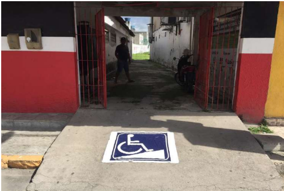
Acesso de entrada ao estádio

O Projeto BELO JARDIM DE RENDIMENTO, oferece aulas de futebol de campo, no Estádio José de Souza Cavalcante na cidade de Belo jardim – PE, localizado no bairro de São Pedro e, dispõe de uma boa localização, com condições de acessibilidade para portadores de deficiência, atendendo a participação desse público.